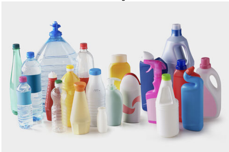
Exemples d'emballages en plastique traditionnellement recyclés.