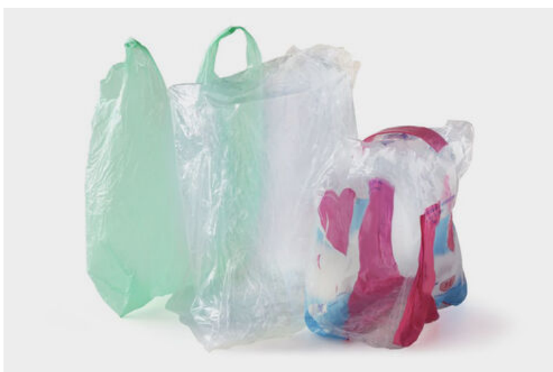
N'oubliez pas de trier aussi les sacs en plastique et les suremballages de bouteilles.

Désormais tous les emballages ménagers en plastique sans distinction se trient dans le bac vert à couvercle jaune ou dans les conteneurs d'apport volontaire à bandeau jaune.