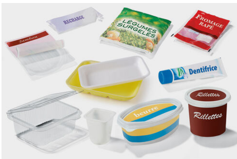
Exemples des nouveaux emballages en plastique qui doivent maintenant être également triés.